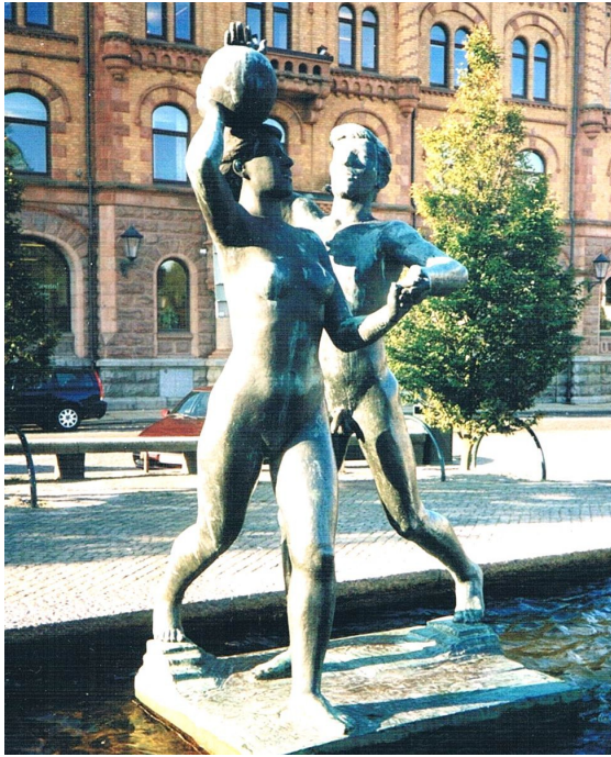
Ballspielendes Paar im Marktbrunnen in Varberg / Südschweden. Skulpturen von Bror Marklund

Offensichtlich handelt es sich bei den beiden nicht um ein Liebespaar. Junge Menschen, die so unverkrampft miteinander umgehen können, spielen nicht nur gerade Ball, sondern sie spielen sogar mit der Weltkugel. Das heißt, sie gestalten die Welt in einer völlig neuen Weise. Bedingung ist, dass sie von dieser Möglichkeit der Gestaltung (rechtzeitig) erfahren. Wenn sie nun davon nicht erfahren, dann bedeutet das doch, dass sie manipuliert werden, weil sie keine attraktive Alternative kennen.